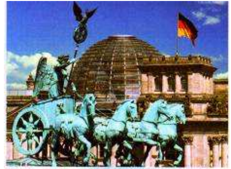
Die Quadriga auf dem Brandenburger Tor. Hinter der Quadriga das Reichstagsgebäude.