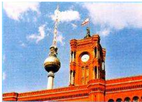
Der Fernsehturm von Berlin. In der Kugel, hoch über der Stadt, ein Restaurant. Vor dem Turm das „Rote Rathaus“.

Wir fahren über die Spree. Hier auf der linken Seite sehen Sie den Platz der Republik und dahinter das Reichstagsgebäude. Das Gebäude ist schon über 200 Jahre alt, aber die große Glaskuppel in der Mitte ist neu. Im Reichstag können Sie dem Bundestag, also dem Parlament, bei seinen Beratungen zusehen.