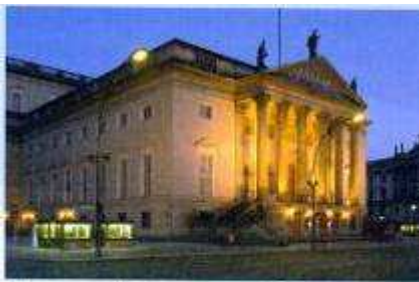
Die Deutsche Staatsoper in der Straße „Unter den Linden“.

Wir fahren über die Spree. Hier auf der linken Seite sehen Sie den Platz der Republik und dahinter das Reichstagsgebäude. Das Gebäude ist schon über 200 Jahre alt, aber die große Glaskuppel in der Mitte ist neu. Im Reichstag können Sie dem Bundestag, also dem Parlament, bei seinen Beratungen zusehen.