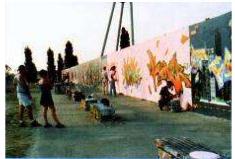
Die Reste der Mauer zwischen Ost- und West-Berlin. Bis 1989 hat sie Berlin in zwei Teile geschnitten.

Und jetzt kommen wir zum Brandenburger Tor. Oben auf dem Tor sehen Sie die Quadriga: vier Pferde vor einem Wagen. Die hat Napoleon mal nach Frankreich mitgenommen, aber später ist sie wieder nach Berlin zurückgekommen. Wir sind jetzt auf der Straße „Unter den Linden“. Hier finden Sie die berühmten Gebäude des alten Berlin. Viele waren nach dem Krieg zerstört. Einige hat man restauriert, zum Beispiel die Deutsche Staatsbibliothek, die Deutsche Staatsoper und die Humboldt-Universität. Auf der rechten Seite sehen Sie jetzt den Fernsehturm am Alexanderplatz. Der Turm ist 368 Meter hoch. Oben in der Kugel ist ein Restaurant. Dort können Sie hoch über der Stadt gemütlich essen und dabei Berlin von oben betrachten. So, meine Damen und Herren, hier sehen Sie jetzt einen Rest der Berliner Mauer, ein trauriges Symbol deutscher Politik. Diese Mauer hat bis 1989 Berlin in zwei Teile