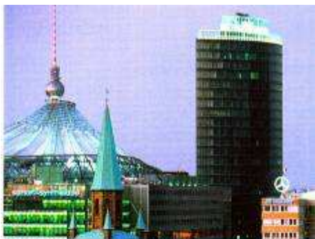
Am Potsdamer Platz. Neben dem Hochhaus das Sony-Center (hinter der Kirche); hinter dem Sony-Center der Fernsehturm.

geschnitten: Ost-Berlin und West-Berlin. Die Mauer war 46 Kilometer lang. Dieser Rest soll an die Teilung Deutschlands erinnern. Zum Schluss unserer Stadtrundfahrt halten wir am Potsdamer Platz. Er war nach dem Krieg fast völlig zerstört. Alle diese modernen Gebäude hier hat man erst nach der Wiedervereinigung der beiden deutschen Staaten gebaut. Hier ist unsere Stadtrundfahrt zu Ende. Ich hoffe, dass es Ihnen gefallen hat, und wünsche Ihnen noch einen schönen Aufenthalt in Berlin.